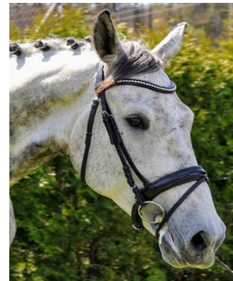
Carlos XXVIII CH

Signalement: Stute/dbraun/07/CH Stm. 1.80m