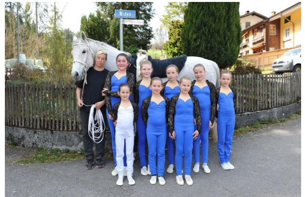
Gruppe Junioren 3 Kat. B