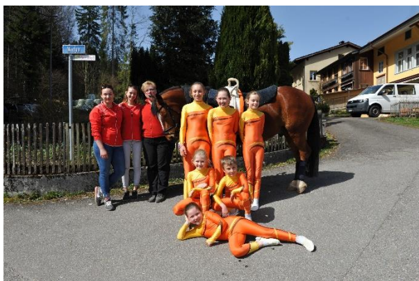
Gruppe Junioren 4 Kat. BJ