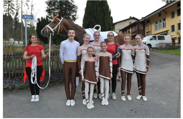
Gruppe Junioren 1 Kat. SJ