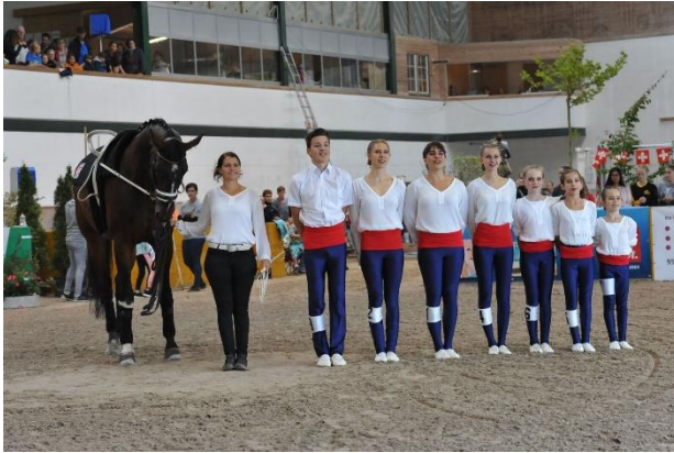
Gruppe Elite 1 Kat. S