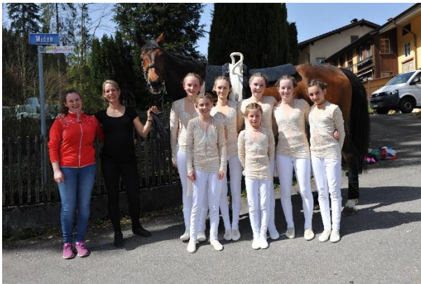
Gruppe Junioren 2 Kat. MJ