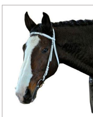
SH Lianos CH

Signalement: Stute/dunkelbraun/92/NL Stm. 1.59m